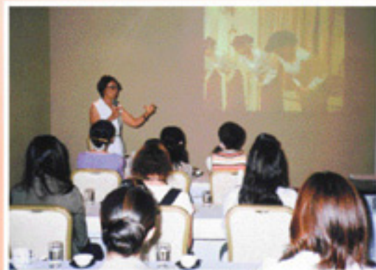
▲テーブルミーティングで「望ましい教育訓練者」の養成