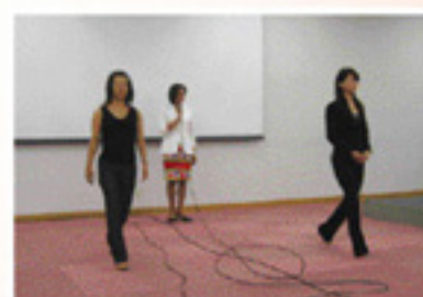
▲教育訓練及び実技指導