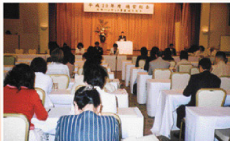
平成20年度の全国総会▶