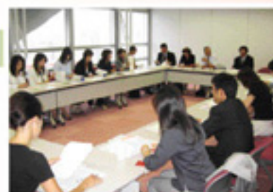
▲全国研修会における意見交換会

その後、平成8年には通商産業大臣の認可を頂き、日本バンケット事業協同組合へと法人化し、業界の健全な発展を目指すとともに、組合員同士の協力・情報交換・レセプタントの教育訓練・ユニフォーム等の共同仕入などの活動を積極的に行ない、名実ともに業界を代表する団体として、活発な活動を展開しつつ今日に至っております。