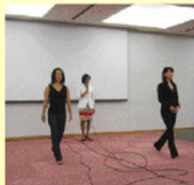
▲教育訓練の実技指導