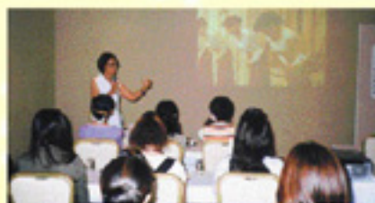
▲テーブルミーティングで「望ましい教育訓練者」の養成

組合が毎年開催するレセプタント研修会、各支部別のブロック研修会をはじめ、組合員各社における新人教育等、バンケットサービスに不可欠な人格形成・技術の習得等の教育訓練は、バンケットサービス事業者として最重要なものと考えています。